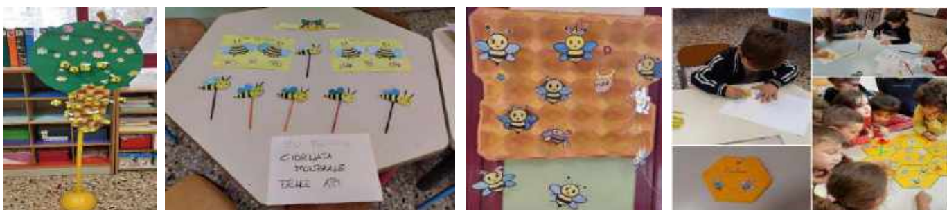
Infanzia sezioni A-B-D-E-F via Bainsizza