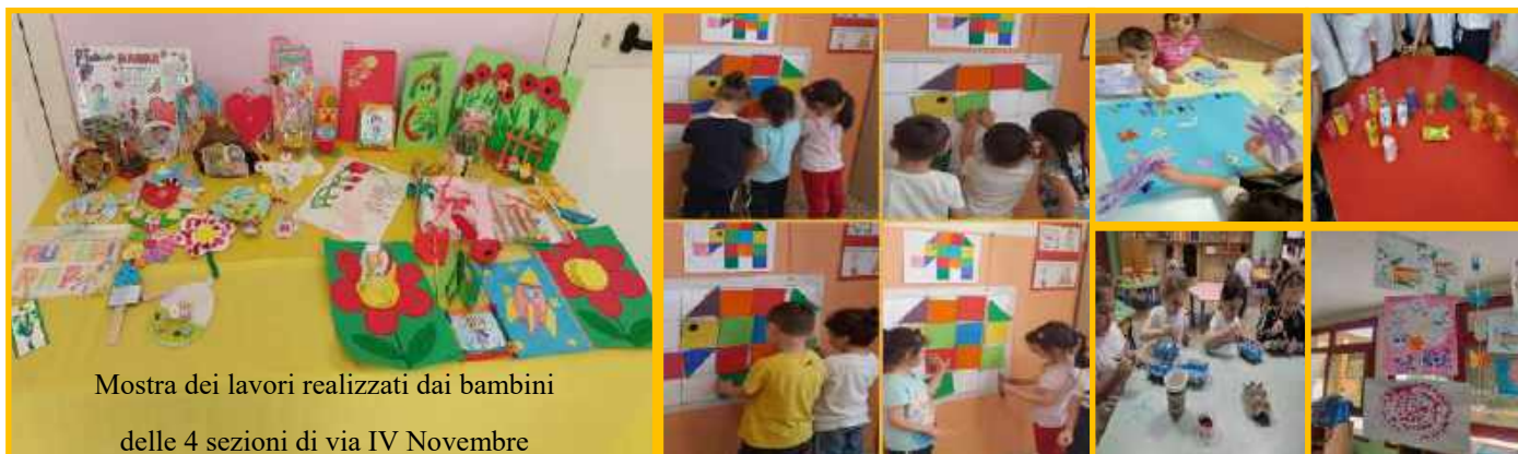
Mostra dei lavori realizzati dai bambini delle 4 sezioni di via IV Novembre