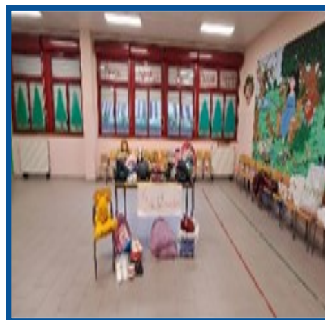
Via di Gregorio