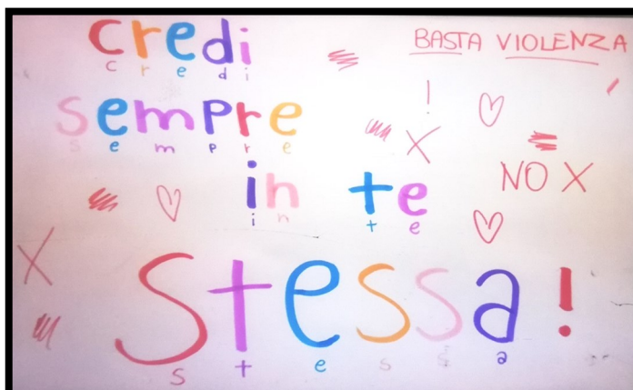
G. Monteserrato cl. 3C